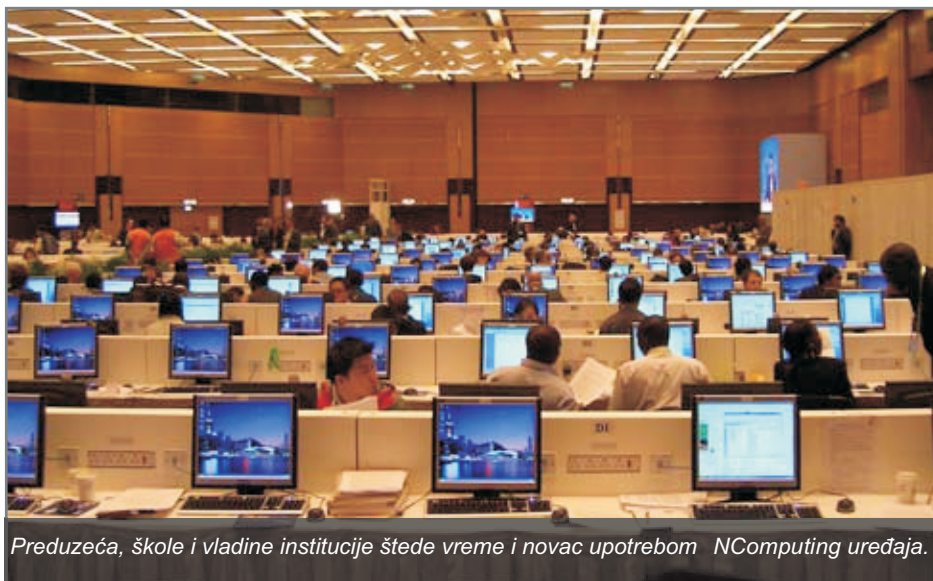
Preduzeća, škole i vladine institucije štede vreme i novac upotrebom NComputing uređaja.

EXPO COMM. MÉXICO 2008 1 st Place Best solution for small business